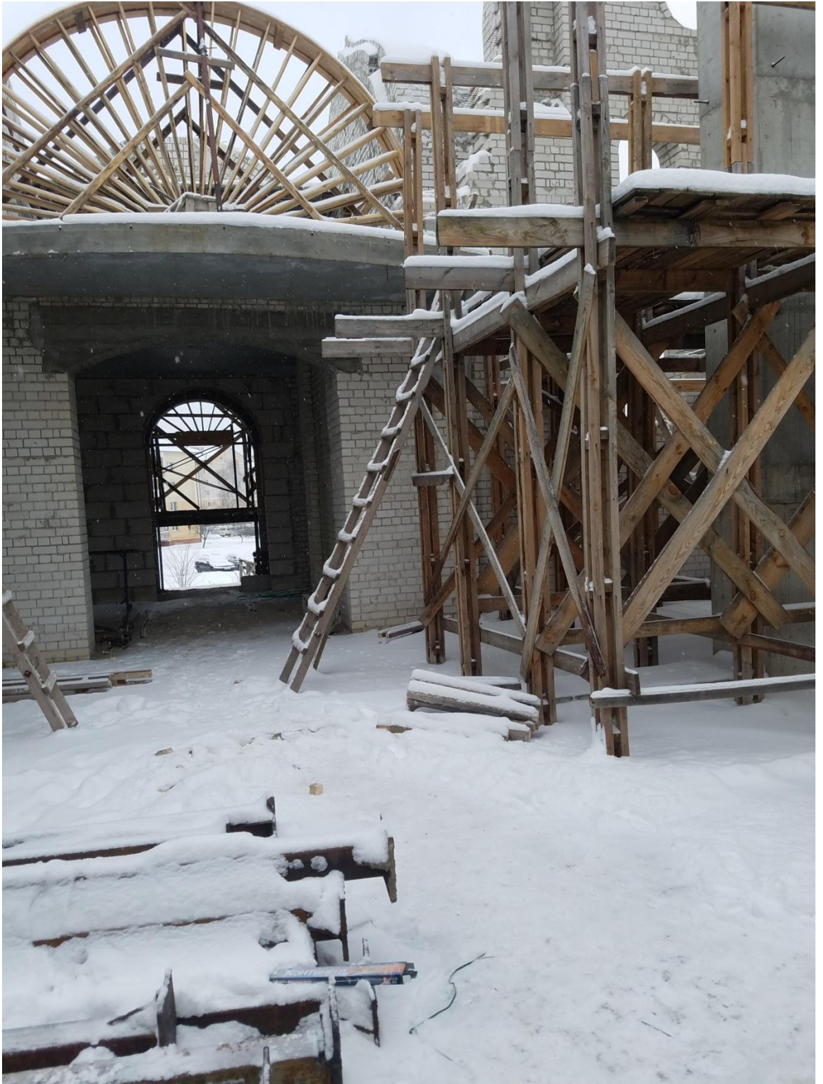
Подъем на леса по деревянной лестнице сбитой гвоздями. Отсутствует ограждение перепадов по высоте.