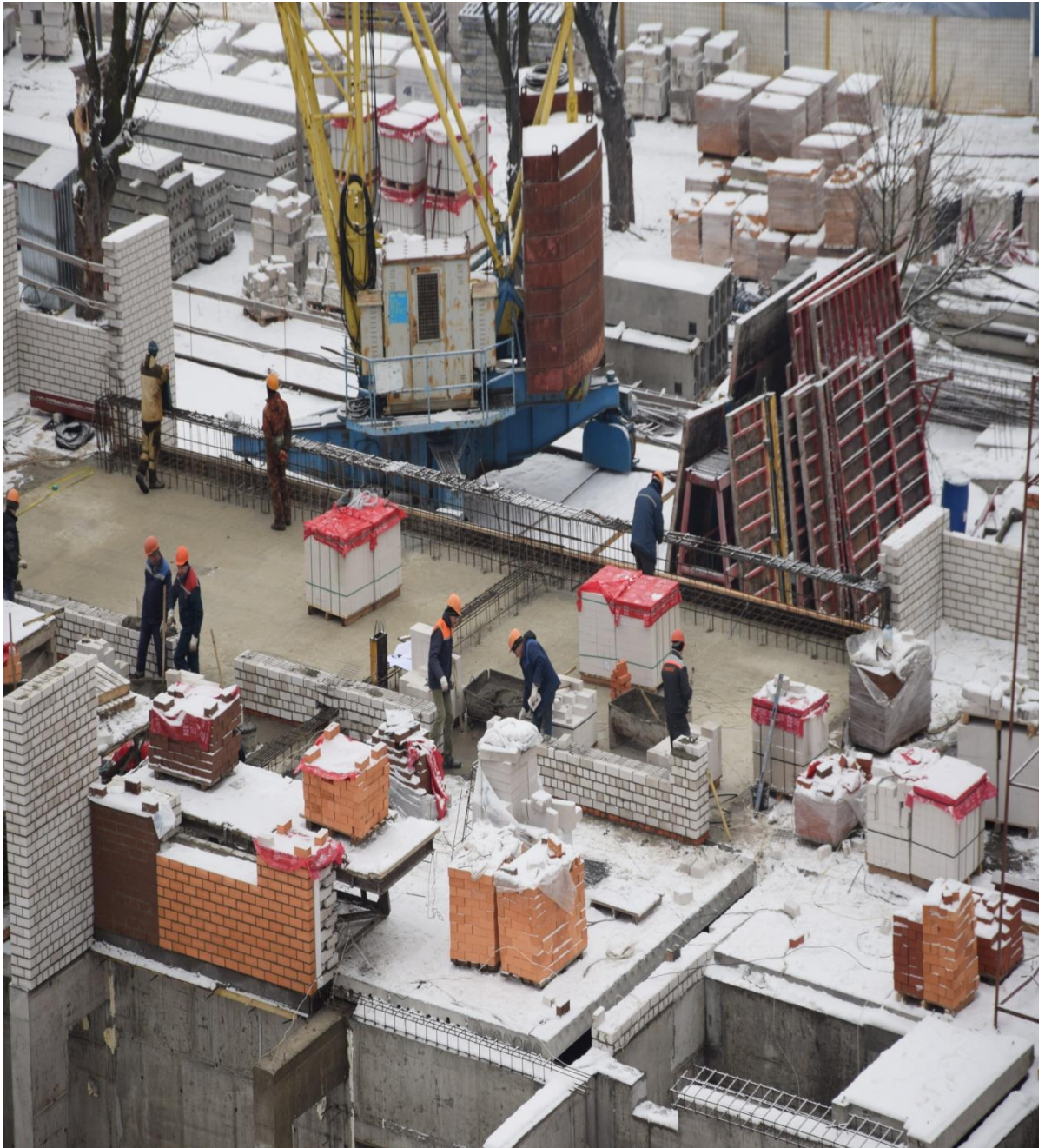
Отсутствуют ограждения перепадов по высоте.