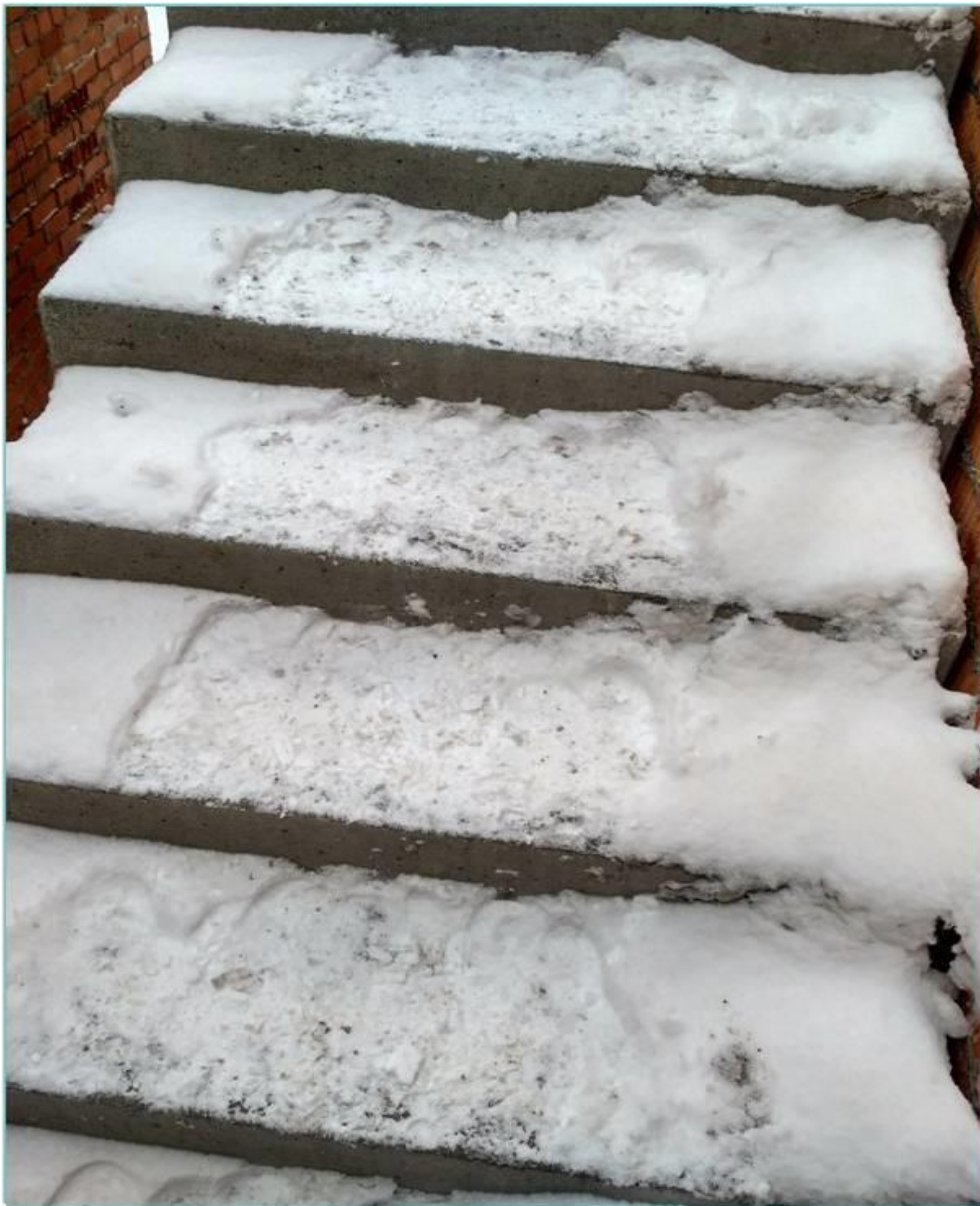
Проходы к рабочим местам не очищаются от снега.